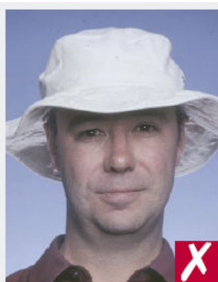
Port d'un chapeau

Les montures ne doivent pas être trop épaisses ni masquer ses yeux.