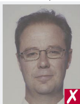
Couleurs trop fades

Etre imprimées sur du papier photo de qualité et avec une haute résolution.