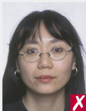
Montures masquant les yeux