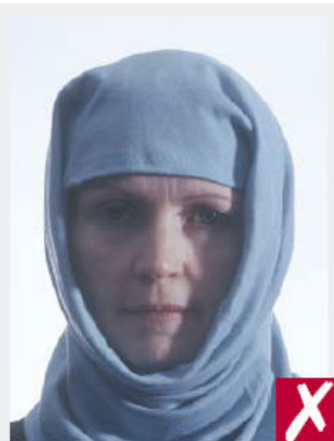
Ombres sur le visage