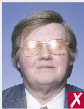
Reflets sur les verres