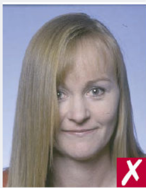
Cheveux sur le visage