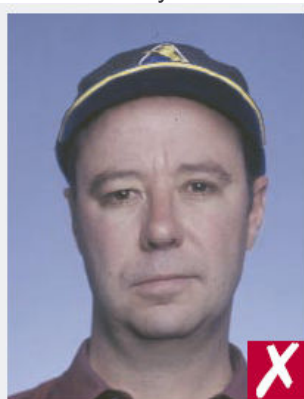
Port d'une casquette